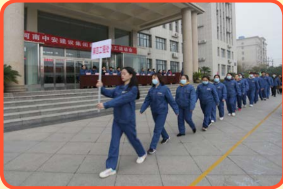
各单位代表队接受检阅